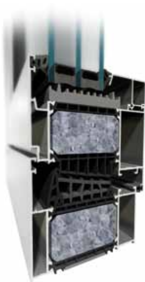
MB-104 Passive SI