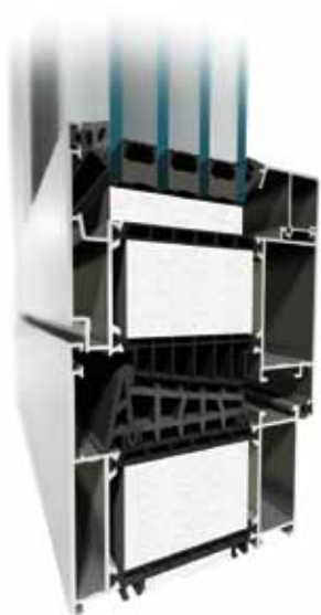
MB-104 Passive Aero